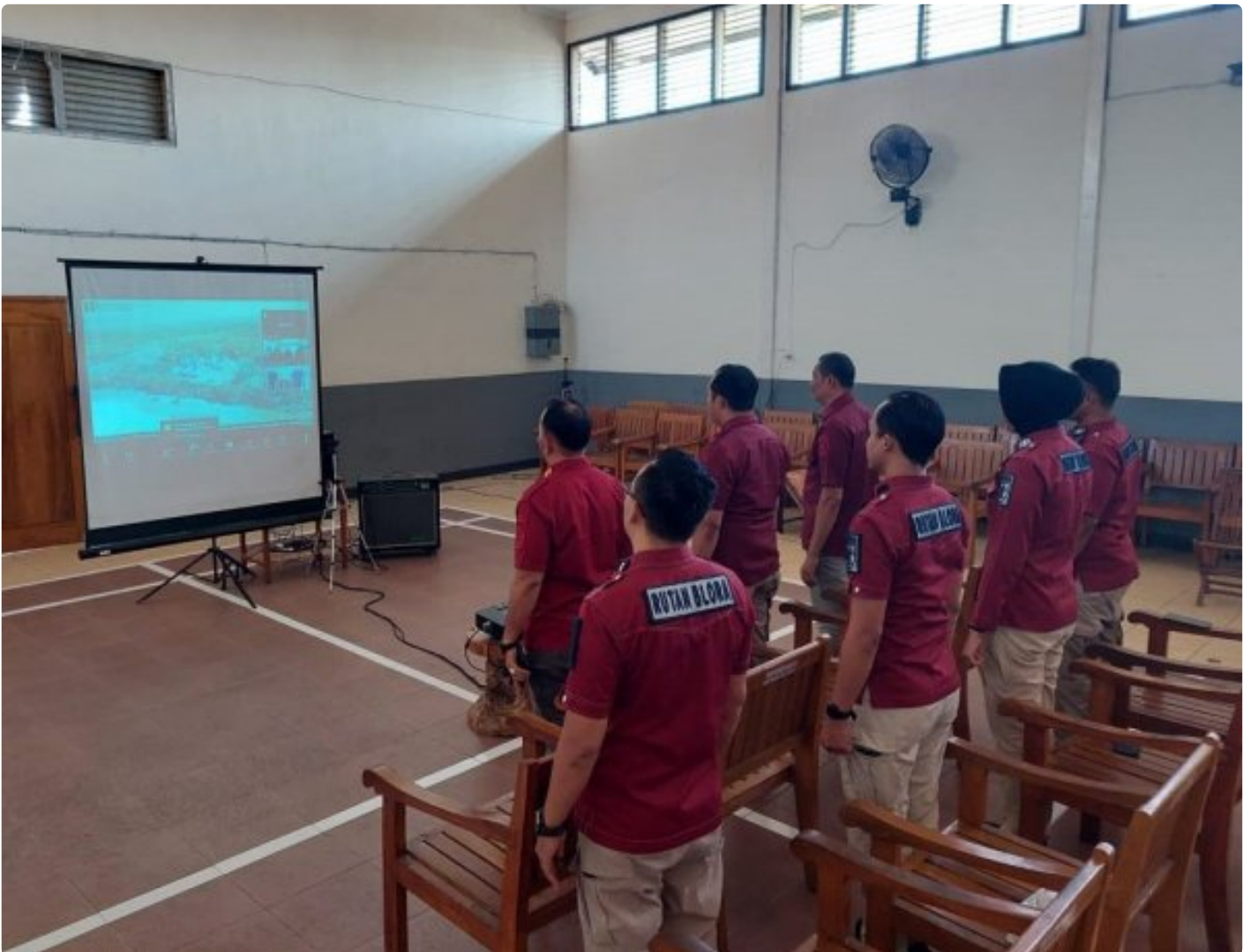
Rutan Blora Ikuti Webinar Series 5 Bersama BPSDM Hukum dan HAM

Blora – Rumah Tahanan Negara (Rutan) Kelas IIB Blora Kantor Wilayah Kementerian Hukum dan Hak Asasi Manusia (Kemenkumham) Jawa Tengah mengikuti Webinar Series 5 bertema “Powerful Coaching, Mentoring, dan Counseling untuk Perubahan Organisasi dan Pengembangan Kompetensi ASN.” Kegiatan yang diadakan oleh Badan Pengembangan Sumber Daya Manusia